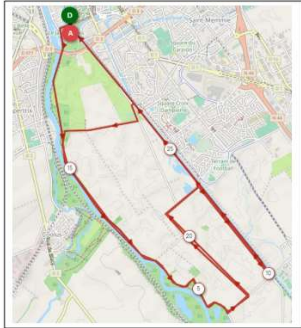
Parcours VTT Gravel 1 boucle soit 13,75 km